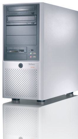
Computer ab Fr. 599.--