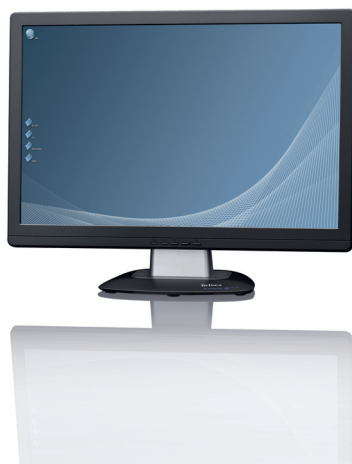
Bildschirme ab Fr. 279.--